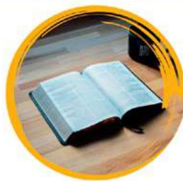
религиозные убеждения или принадлежность к конфессии