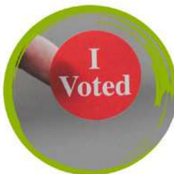
принадлежность к политической партии, профсоюзу и другой общественной организации

за исключением случаев, когда это может быть очень важным в отношении выполняемой работы