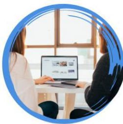
Palīdzība darba meklējumos