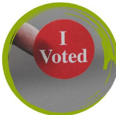
piederību politiskai partijai, darbinieku arodbiedrībai vai citai sabiedriskai organizācijai

izņemot gadījumus, kad tam var būt būtiska nozīme attiecībā uz veicamo darbu