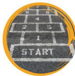
Konsultācijas par karjeras izveidošanu vai biznesa uzsākšanu