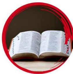
Latviešu valodas kursi un arodmācības