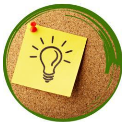
Informācija par vakancēm

Lai palīdzētu atrast darbu, Nodarbinātības valsts aģentūra sniedz šādus pakalpojumus: