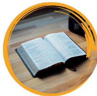
relīģisko pārliecību vai piederību pie reliģiskas kopienas