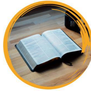
المعتقد الديني أو الانتماء إلى طائفة دينية