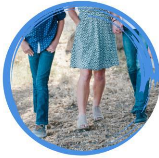
الأسرة أو الحالة الاجتماعية