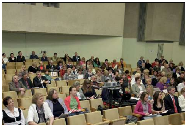
LSK XVII kongresa dalībnieki