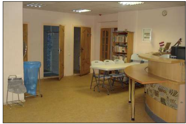
LSK Sociālā centra «Gaiziņš» telpas