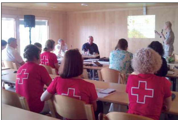
LSK organizētā starptautiskā konference Abruģciemā