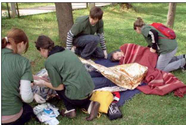
2013. gada aktivitātes LSK Rēzeknes komitejā

2013. gadā Rēzeknes komitejā tika ieviesti vairāki jauni un nozīmīgi projekti. Sadarbībā ar fondu Ziedot un veikalu tīklu Rimi , 2013. gada jūnijā—augustā tika īstenots projekts Kopgalds . Projekta mērķis bija nodrošināt ar pusdienām bērnus, kas apmeklēja dienas nometni Štābiņš. Tāpat