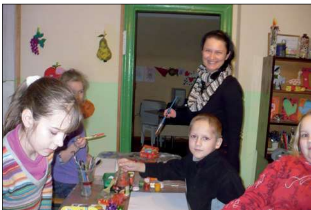
Bērnu radošās darbnīcas Valkas komitejā

LSK Valkas komitejā strādā 41 brīvprātīgais. 2013. gadā brīvprātīgie aktīvi piedalījās labdarības akcijās Balta, balta mana sirds , Ziemassvētku akcijās Valkas un Smiltenes novadā, PP sacensībās, donoru dienu, tematisko pasākumu organizēšanā un citos pasākumos. Brīvprātīgie strādā palīdzības centros Valkā, Smiltēnē un Strenčos.