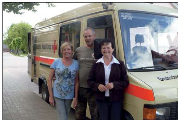
Vācijas SK delegācija viesojas LSK Valkas komitejā