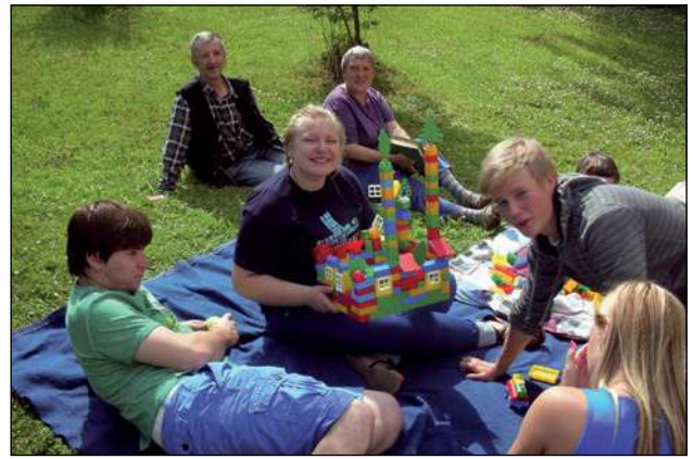
SAC «Stūrīši» brīvprātīgie

Grobiņā LSK Kurzemes komiteja ir atjaunojusi darbību, piedāvājot iedzīvotājiem gan Higiēnas centra pakalpojumus, gan aicinot saņemt konsultācijas Veselības istabā , kā arī sadarbībā ar pilsētas aktīvajiem pensionāriem, rīkojot pasākumus Dienas centrā.