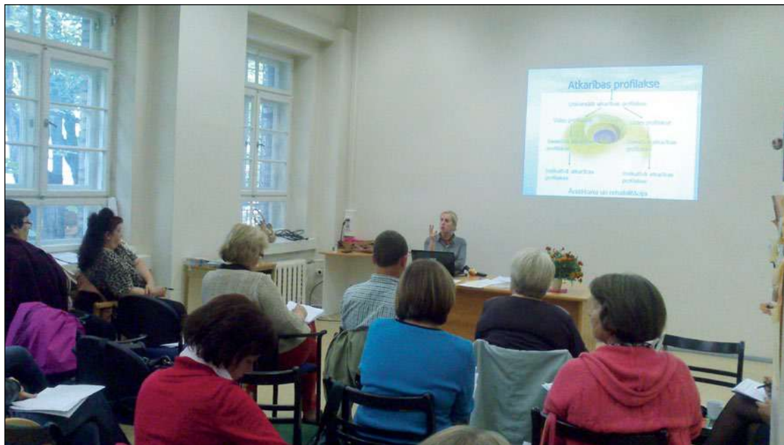
2013. gada laikā veselības istabu darbiniekiem tika organizētas apmācības «Atkarība un līdzatkarība» un «Darbs ar klientu. Komunikācija»

Ar Rīgas domes Labklājības departamenta (LD) finansiālu atbalstu Rīgā 2013. gadā darbojas sešas veselības istabas: Aglonas ielā 35/3-12, Gaiziņa ielā 7-14, Aptiekas ielā 8-13, Brīvības ielā 237/2-12, Slokas ielā 161-10 un Šarlotes ielā 1B-12. Savukārt 2014. gada sākumā Rīgā plānots atvērt septīto veselības istabu Lomonosova ielā 1-k19.