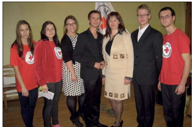
LSK Saldus komitejas 2013. gada aktivitātes