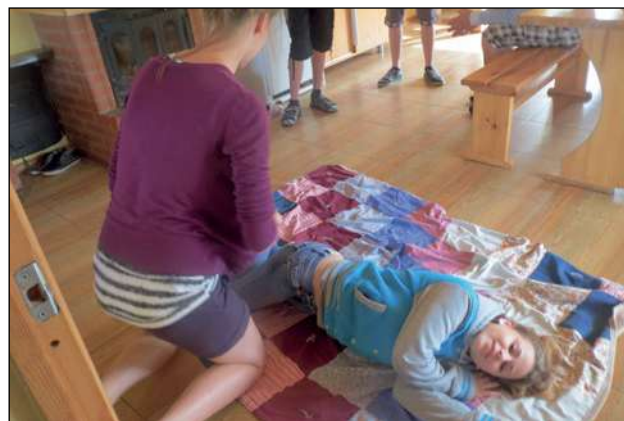
Nometnes «Drošs un vesels» aktivitātes jauniešiem