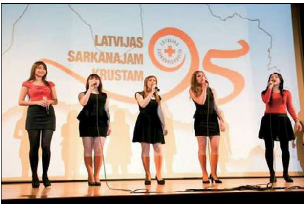
LSK izstādes atklāšana