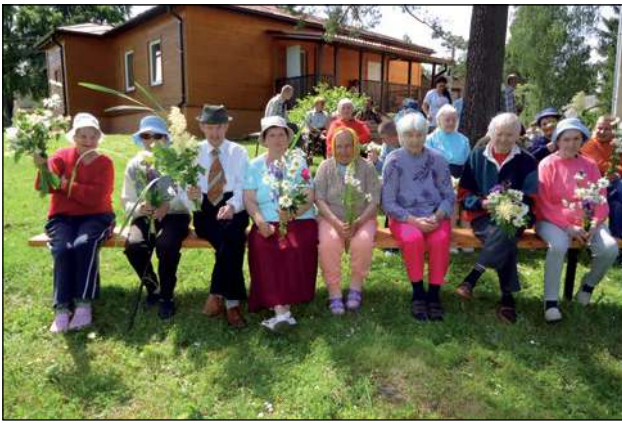
Svētki SAC «Stūrīši»