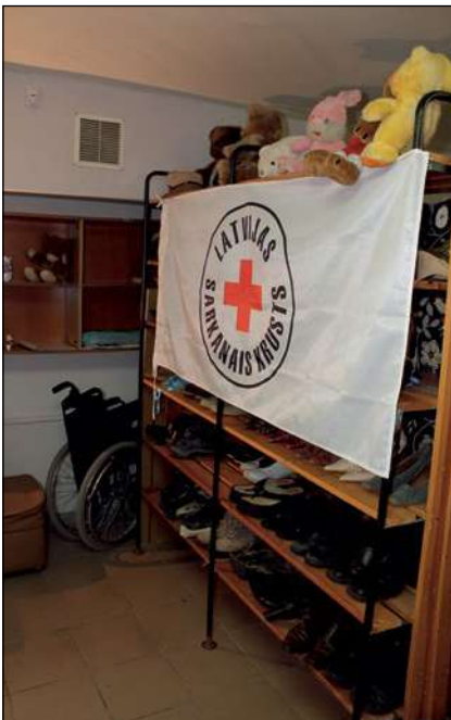
Viens no LSK humānās palīdzības punktiem

LSK programmā piedalās no 2008. gada un šobrīd ir lielākais pārtikas paku izdalītājs, nodrošinot 95% pārtikas paku izdali Latvijā. Bez LSK, programmā piedalās un pārtikas pakas Latvijā daļa vēl septiņas labdarības organizācijas. No 2009.—2013. gadam pārtikas paku izdales vietu skaits ir palielinājies no 175 līdz 415. EK programmas vistrūcīgākajām personām ieguvēji galvenokārt ir bezdarbnieki, daudz bērnu ģimenes, personas un ģimenes ar zemiem ienākumiem, cilvēki ar īpašām vajadzībām un vecāka gadagājuma cilvēki. Lai saskaņā ar programmu saņemtu pārtikas produktus, ģimene vai atsevišķi dzīvojoša persona uzrāda pašvaldības sociālā dienesta izsniegto izziņu. 2013. gada programma no ES paredzēja astoņu mēnešu paku izdalīšanu no maija līdz decembrim. Sakarā ar papildus pārtikas komplektu saņemšanu un izveidotajiem uzkrājumiem, tie tiks dalīti arī 2014. gada janvārī un citos mēnešos. Piegādāto pārtikas produktu komplekts 2013. gadā svēra ap 3 kg. Tajā bija iekļauts pilnpiena pulveris, makaroni, tvaicēti rīsi, griķi, manna, kviešu milti un sautēta cūkgaļa.