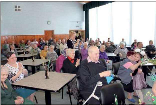
Lieldienu pasākums veco ļaužu pansionātā