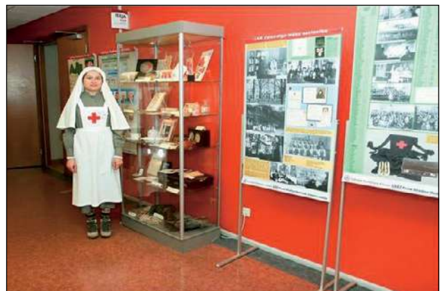
LSK izstādes eksponāti