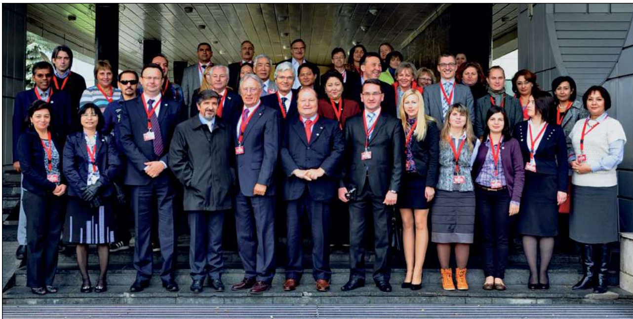
SSKSP nacionālo biedrību Eiropas reģiona sanāksmes dalībnieki.

Septembrī LSK tika pārstāvēta ikgadējā SSKSP nacionālo biedrību Eiropas reģiona sanāksmē, kas notika Baltkrievijā, Minskā. Konferencē tika runāts par tēmu Neaizsargāto migrantu HIV un tuberkulozes ārstēšanas pieejamība. Pasākumā piedalījās 44 dalībnieki no 19 dažādām nacionālajām biedrībām, kā arī Federācijas, Eiropas zonas un ART ( Asian RC/RC HIV/AIDS network ) tīkla pārstāvji.