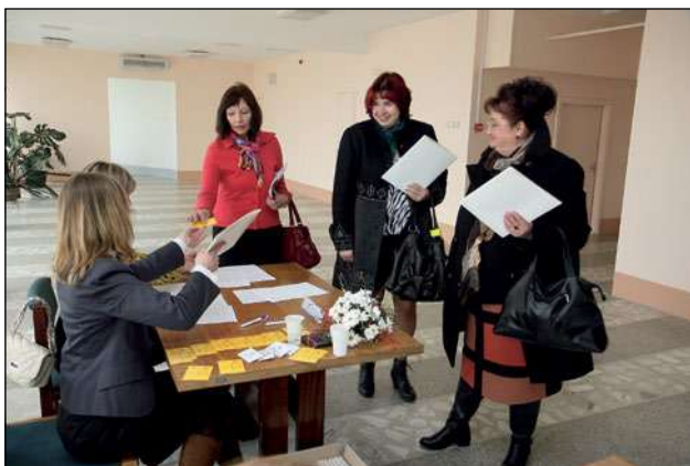
LSK delegātu reģistrācija

2013. gada 26. aprīlī notika LSK XVII kongress , kurā piedalījās 84 delegāti un 68 dalībnieki no reģionālajām komitejām, lai vērtētu LSK darbības rezultātus laika posmā pēc iepriekšējā kongresa un noteiktu turpmākās attīstības virzienus un prioritātes.