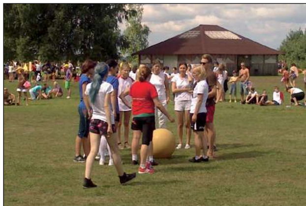
XV veselības dienas Ķegumā