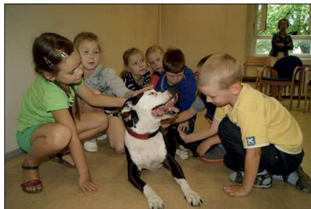
LSK dienas nometne bērniem

2013. gadā LSKJ bija Jaunatnes starptautisko programmu aģentūras (JSPA) reģionālais sadarbības partneris Kurzemes, Zemgales, Vidzemes, Rīgas un Latgales reģionā un nodrošināja organizatorisko atbalstu 21 apmācību, viena reģionālā foruma Kurzemē un vienas reģionālās konferences Zemgalē organizēšanai. Apmācībās un reģionālos pasākumos piedalījās 600 jaunieši.