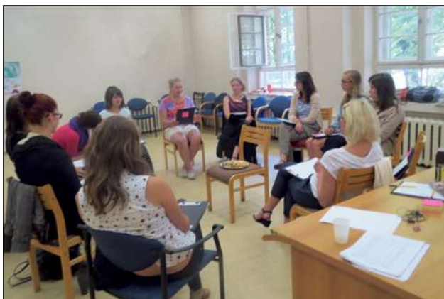
Projekta «Brīvprātīgā vasaras skola» dalībnieki

līdzfinansējumu īstenoja projektu Brīvprātīgo vasaras skola , kas tika īstenots kā atbalsts kvalitatīva un mērķtiecīga brīvprātīgā darba attīstībai Rīgā, kā arī brīvprātīgā darba prakses iegūšanas un kvalitatīva brīvā laika pavadīšanas veids. Projektā piedalījās 25 dalībnieki, un 8 projekta nodarbībās tie apguva komunikācijas, sadarbības, projektu vadības, neformālās izglītības u. c. zināšanas, kā arī ieguva pirmās palīdzības sniegšanas prasmes. Pēc mācībām projekta dalībnieki devās brīvprātīgā darba praksē , lai veiktu brīvprātīgo darbu sev interesējošā jomā. Projektā iesaistītie jaunieši brīvprātīgi vadīja nodarbības un radošās darbnīcas bērniem, palīdzēja veciem cilvēkiem, piedalījās talkās un dabas aizsardzības pasākumos, organizēja pasākumus sociālās aprūpes institūcijās, rūpējās par dzīvniekiem, fotogrāfēja un filmēja pasākumus, kā arī veica citus darbus, kopumā nostrādājot 1890 brīvprātīgā darba stundas.