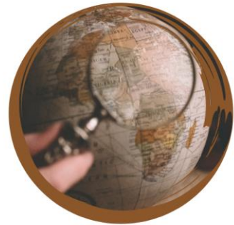
الأصل القومي أو العرقي