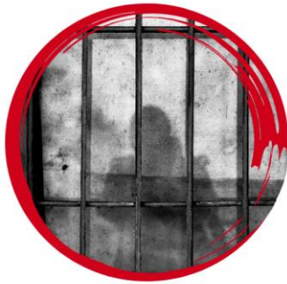
حكم سابق إلا في الحالات التي قد يكون فيها هذا الأمر ذا أهمية أساسية فيما يتعلق بالعمل الذي يتعين القيام به